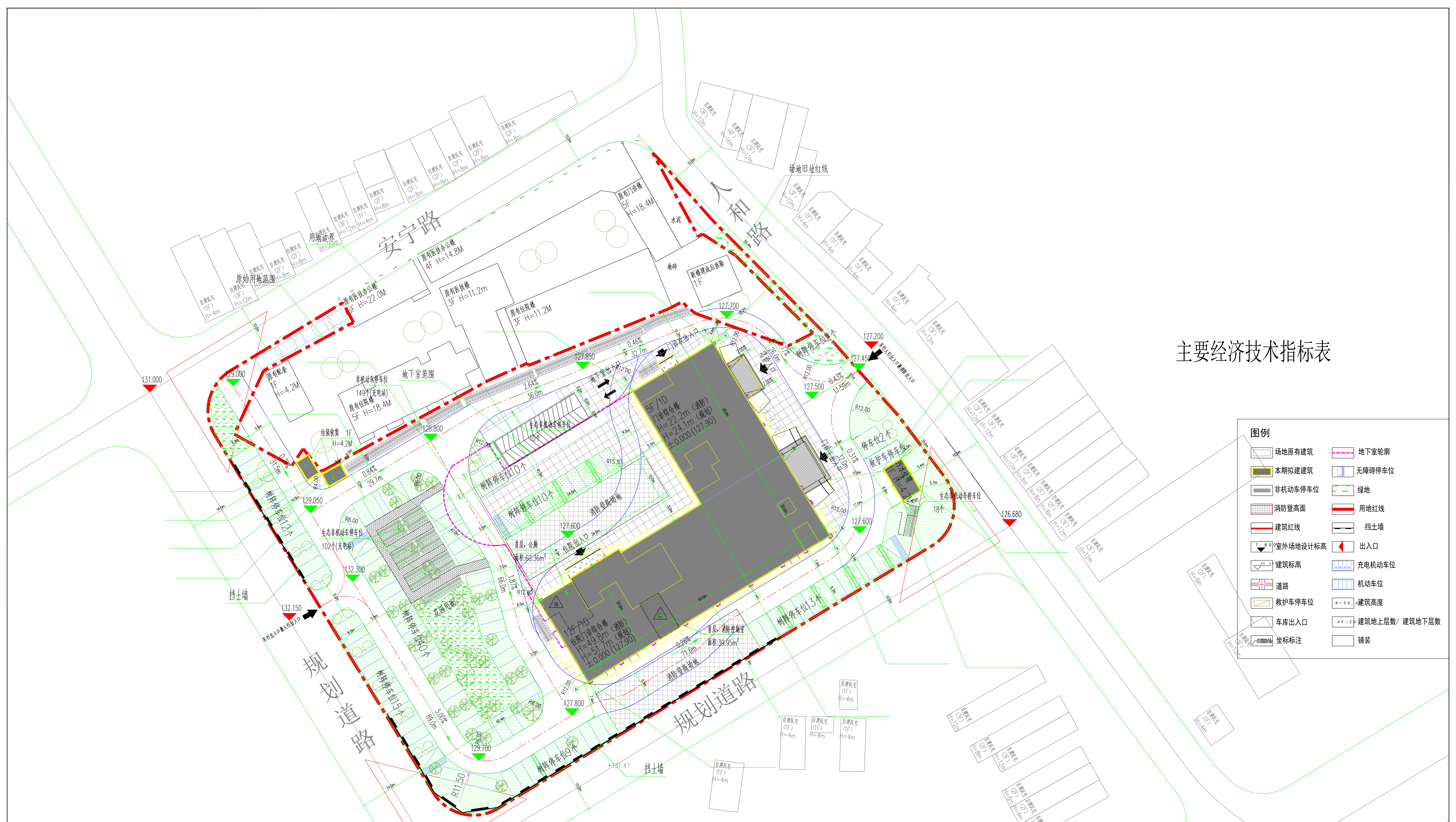
主要经济技术指标表